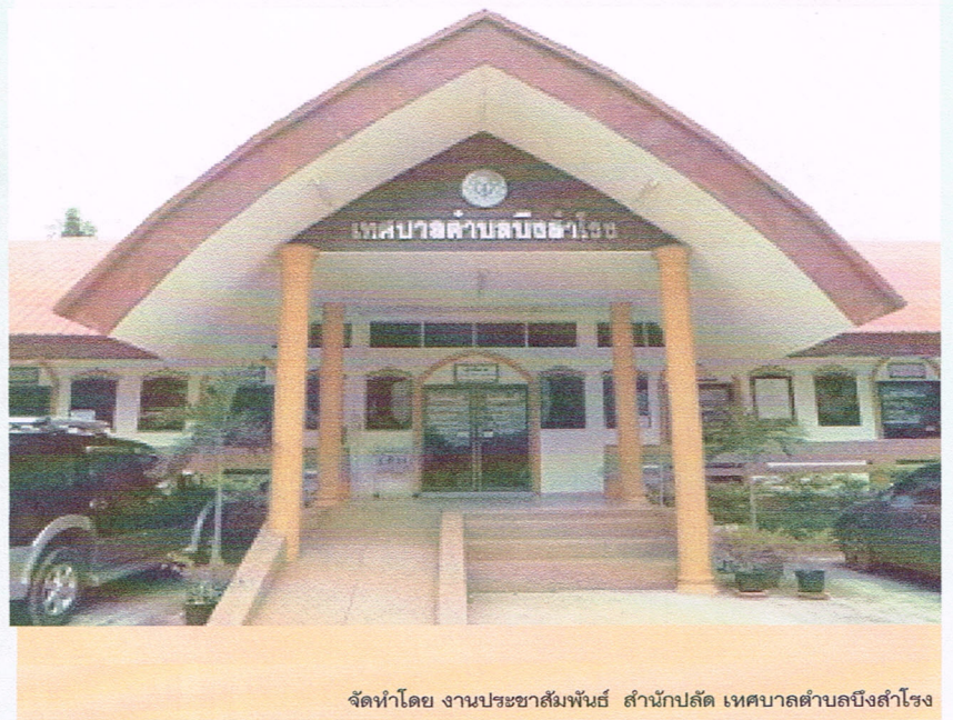
จัดทำโดย งานประชาสัมพันธ์ สำนักปลัด เทศบาลตำบลบึงสำโรง